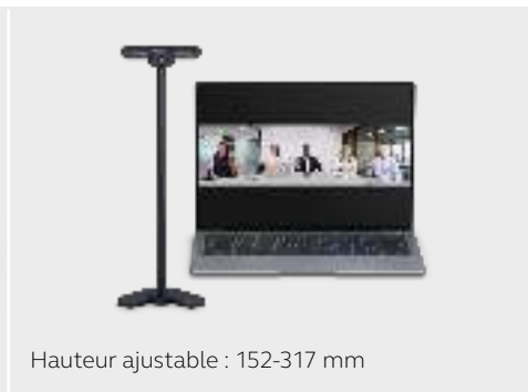
Hauteur ajustable : 152-317 mm