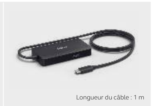
Longueur du câble : 1 m